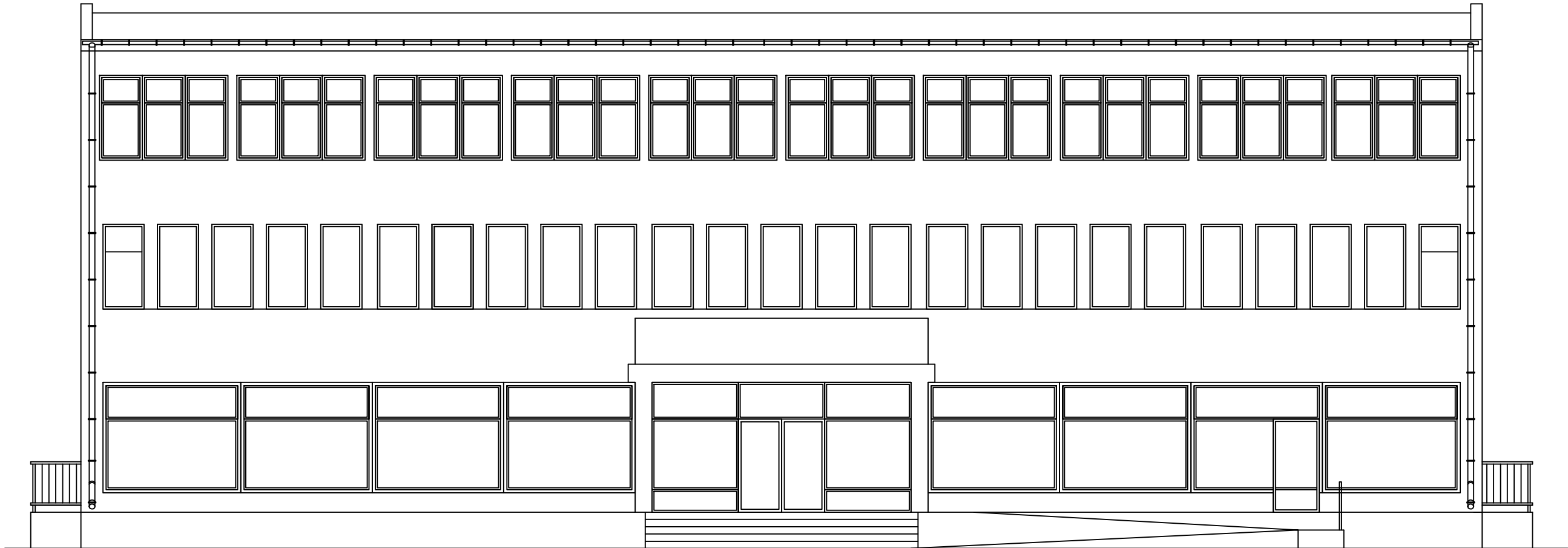
ELEWACJA FRONTOWA - INWENTARYZACJA 1:100