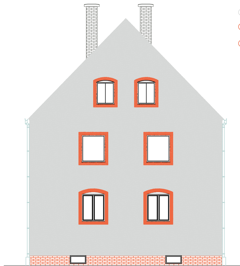
KOLORYSTYKA ELEWACJI BOCZNEJ