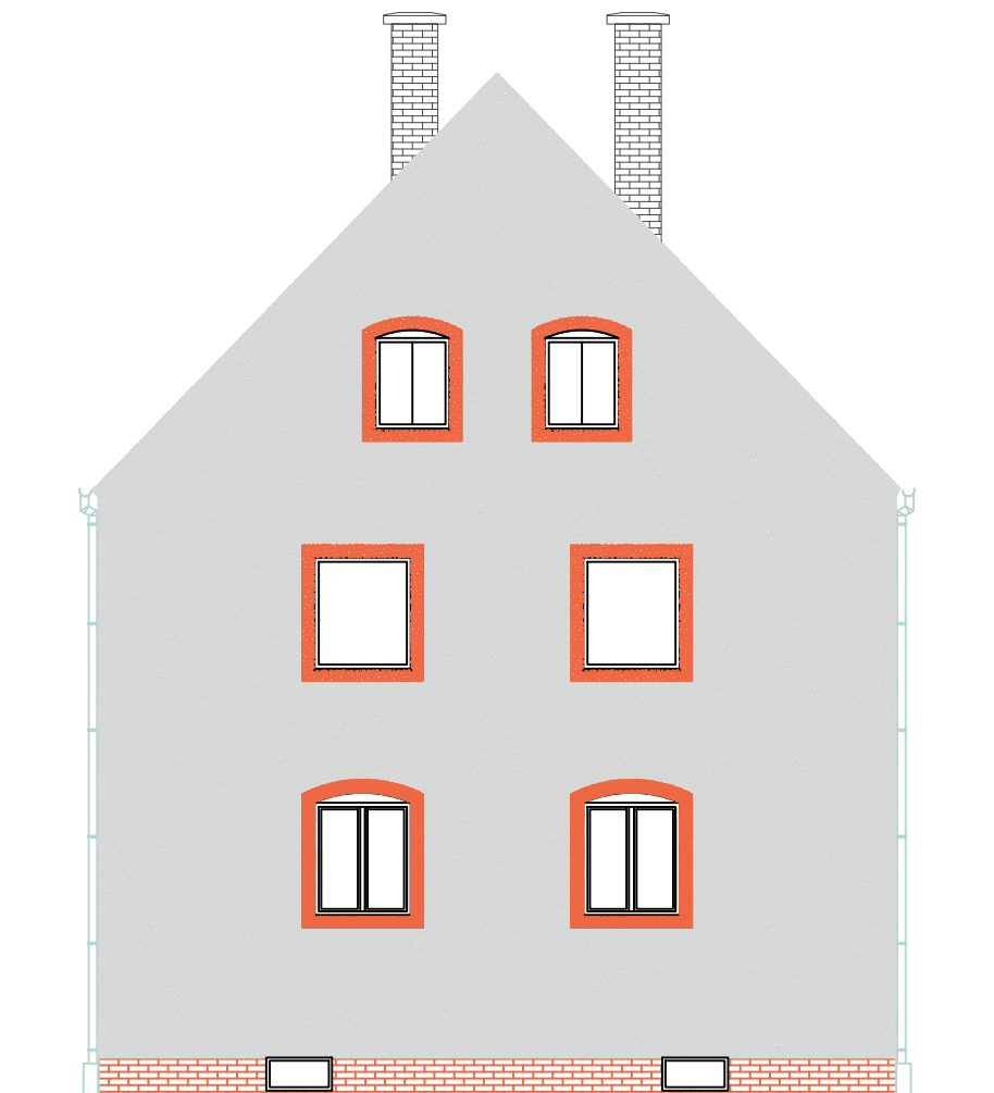
KOLORYSTYKA ELEWACJI BOCZNEJ